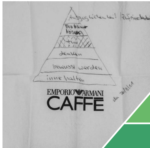
Erste Gedanken & Notizen 2010 in einem Münchner Café